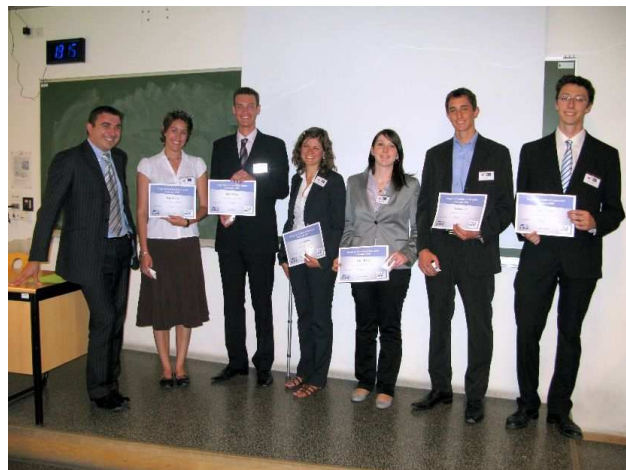
Remise du Prix INEVO Technology

La société INEVO Technology accompagnera pendant un an le projet Wit'Zen pour l'aider dans sa phase d'anté-création.