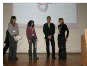
Bourses de l'AAE CPE Lyon

Cette journée a également été l'occasion pour les partenaires de CPE Lyon de remettre officiellement les bourses attribuées pour cette année à des étudiants de l'Ecole.