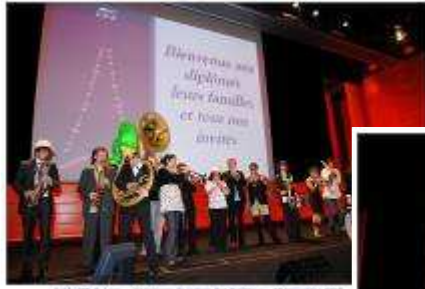
La Cacophonie Presque Ecoutable, la Fanfare de CPE Lyon

Cette cérémonie a démarré dans la bonne humeur avec la fanfare de CPE Lyon.