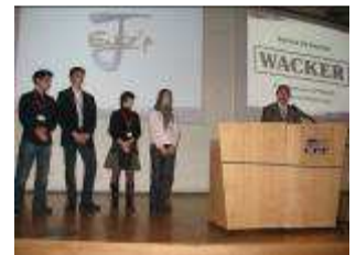
Bourses WACKER Chemie

Un grand bravo aux étudiants de CPE Lyon pour l'excellente organisation de cette journée. La prochaine Journée Entreprise se déroulera le jeudi 10 décembre 2009.