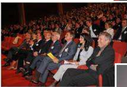
Bonne humeur dans l'assistance avec le speech des jeunes diplômés