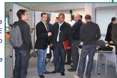
Visite d'une vingtaine d'étudiants de CPE Lyon chez Cap Gemini * 2 ème et 3 ème année du cursus ingénieur

Par ailleurs, le 8 novembre dernier, ce sont nos élèves qui sont allés visiter les locaux de Cap Gemini à Saint Priest et participer à des entretiens de sélections.