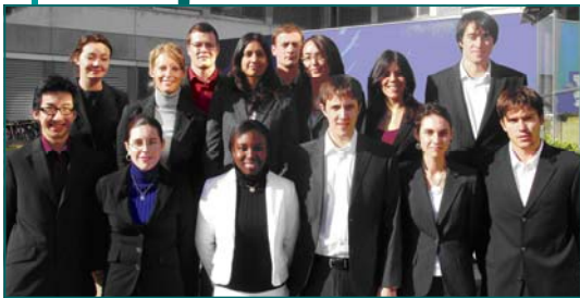
Bureau de l'association « Journée entreprises » 2007

Par ce projet, nous avons pu développer des compétences en leadership et management et améliorer notre vision stratégique d'une organisation.»