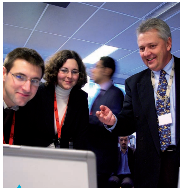
Relations entreprises / étudiants : au cœur des priorités de CPE Lyon

sont lancés eux-mêmes dans la création d'entreprise : un prochain numéro leur sera consacré. Les valeurs fondamentales de CPE Lyon trouvent écho dans les entreprises : l'école compte aujourd'hui 600 partenaires, 35 membres du club entreprises, et fait partie des écoles cibles de quinze d'entre elles.