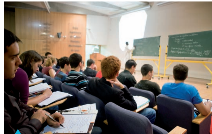
CPE Lyon : nouveau cadre de travail en perspective

CPE Lyon tient à vous entraîner dans cette dynamique à travers ce nouveau journal qui vous est dédié. Le nom que nous avons choisi de lui donner témoigne de notre volonté de faire équipe avec vous. Cette école est aussi la vôtre.