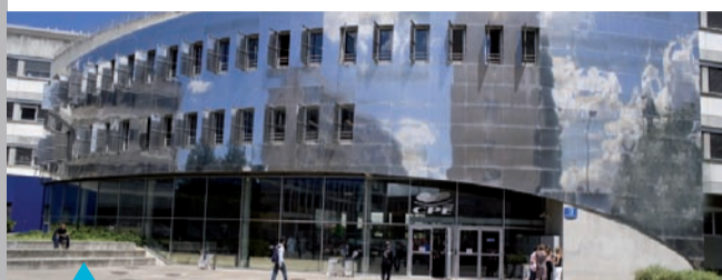
Un nouveau bâtiment accueillera prochainement les étudiants de CPE Lyon

CPE Lyon est au cœur de bouleversements majeurs pour l'enseignement supérieur. Zoom sur trois projets qui vont orienter son avenir.